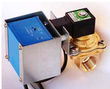
COVA reguleringsventil CA- har nå vært på markedet i 10 år og sikrer balanse i anlegg uten bruk av innreguleringsventiler

Et lite jubileum hos COVA, men med stor betydning innen varme- /kjøleanleggsutførelser. Det gikk hele 10 år med utviklingsarbeid før COVA hadde ferdig et system, hvor energiforbruket får første prioritet, innjusteringsprosessen med tilhørende arbeid er borte, og hvor forenklinger i systemene gir økt sikkerhet mot feil i prosjektering, utførelse og installasjon. Dette var i 2001. Nå har det gått ytterligere 10 nye år. I dag tenker knapt noen på å prosjektere de gammeldagse temperatur-regulerte systemene. Nå er det mengdestyrte systemer som gjelder. Ja, verden går fremover – heldigvis.