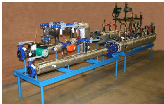
En COVA varmesentral bygget helt som kunden ønsker, både med utstyr og plassering av tilkoblingsstusser.

COVA var en pioner på området, en av de første som tok i bruk mengdestyring som et begrep, og foretok teknisk nybrottsarbeid innen vannbårne energianlegg. Men det er ikke lett å endre en hel bransje, særlig ikke når det finnes en rekke betrevitere som "ikke har peiling", og så hadde vi automatikk-leverandører som følte seg truet, og produsenter som leverer innreguleringsventiler i "bøtter og spann". Det var på ingen måte en lett jobb.